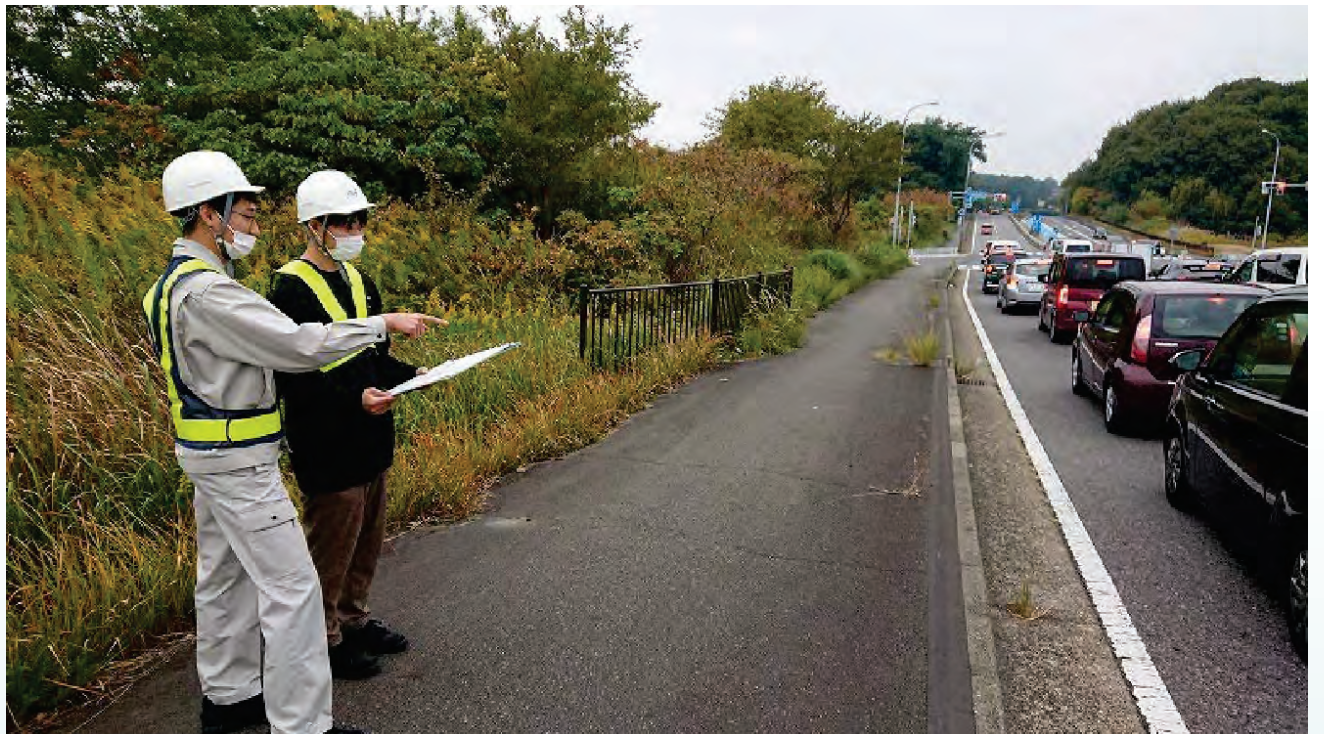
渋滞長の調査状況

この業務は、名四国道事務所管内において、交差点部の渋滞長等の交通状況を把握することです。